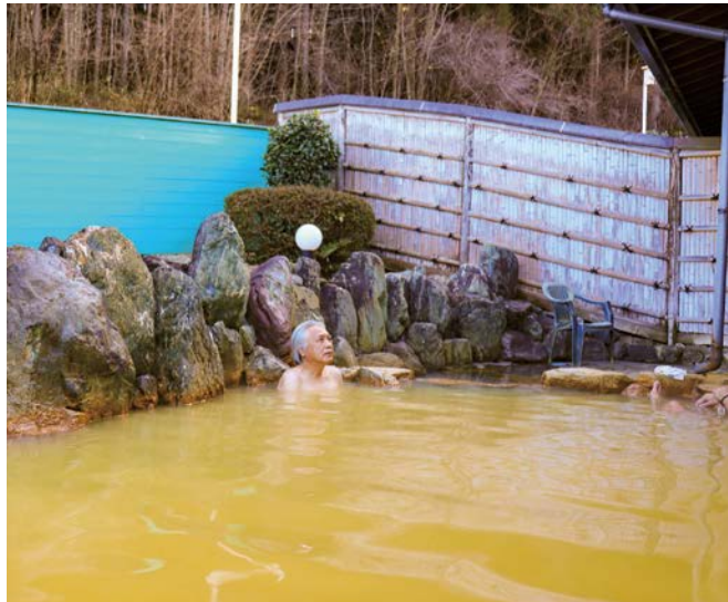
▲太古の地層から湧いた奇跡の湯