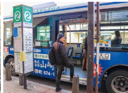
▲高崎駅西口バス乗り場