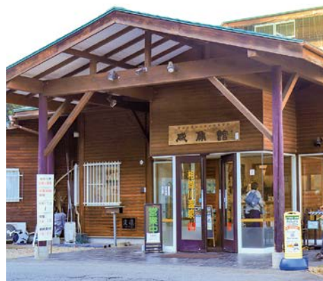
▲相間川温泉「ふれあい館」

温泉が湧いたのは平成7年のこと。源泉の温度は約62度と高温で、湧出量も毎分約200リットルと豊富。何よりも関係者を驚かせたのは、温泉の色だった。湧出時は無色透明だが、時間の経過とともに黄褐色から赤褐色へ