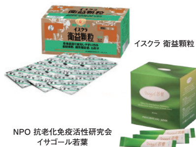
NPO 抗老化免疫活性研究会 イサゴール若葉

二十四節気七十二候最後の「大寒」(1/20)頃、早い方は既に症状が出始める花粉症。症状が強い方は早めの「準備」がおすすめです。花粉症などのアレルギーは、免疫の過剰反応で起る一方、衛気を損なわずに、生活習慣の改善には体の免疫バランスを整えることが必要。冷たいもの(体温以下のもの)、甘いものは控え、睡眠をしっかりと、体を冷やさないよう抑えきれない方や、年々悪化する方は特に、体質改善をおすすめします。他の悩みを漢方で体質改善を