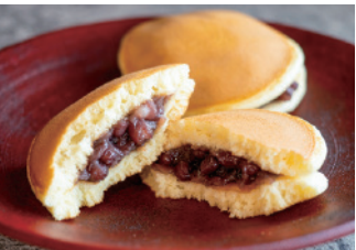
毎朝焼くどらやき (216円)

かで甘く、断りまで赤い。その完熟果実を練乳入り白あんに入れて包み、さらに薄い餅で繊細にくるむ。ひと口かじれば果汁があふれ、白あんが餅の練り具合も、その日の気温と空気で変わる。宮澤さんは毎朝、生地の感触で水分を確かめ、最適