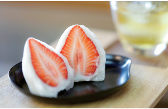
根強いファンを持つちごもち (486円)

高崎の年の瀬をやさしく彩る甘い便り、それが微笑庵の「ちごもち」である。群馬県内の信頼するイチゴ農家と提携し、早朝に3Lサイズの「やよいひめ」を届けてもらう。群馬生まれのブランドイチゴは果汁が豊