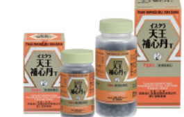
天王補心丹T(てんのうしんたん)