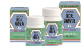
瀉火補腎丸(しゃかほじんがん)

防ぎ、「巡り」を意識すると良いと思います。水運太過の年は重だるさを溜め込みやすいため、動きを促すことが大切です。金（肺）運不及の年、金になりやすいため、無理のない範囲で、日々少し体を動かしましょう。体温を高めたい飲み物も控える方が良いでしょう。呼吸器系の症状が長引く方が多かった印象で、心配なことです。息は「自ら」の心と書きま