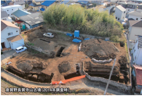
倉賀野長賀寺山古墳(2014年調査時)

今回紹介する倉賀野長賀寺山古墳は、あまり知られていないであろう穴といった前方後円墳を有する倉賀野古墳群からのもので、その周囲は集合住宅の建設に伴い、2014年に発掘調査が行われた。その際、古墳時代の後期の築造と推定されている。古墳の周囲には、後円部の一部が残り、前方部は削平されておひそかに息づいている。古墳だ。 所在地 高崎市倉賀野町橋東 1951の2 取材協力 写真提供 高崎市教育委員会 事務局文化財保護課